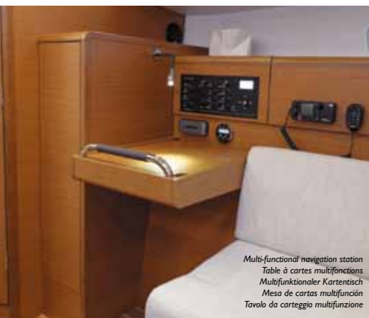
Multi-functional navigation station Table à cartes multifonctions Multifunktionaler Kartentisch Mesa de cartas multifunción Tavolo da carteggio multifunzione

L'ambiente marino è uno degli ecosistemi più fragili del nostro pianeta. Noi partecipiamo attivamente alla sua salvaguardia, come testimonia il rispetto della norma ISO 14001. Tutte le nuove barche sono dotate, di serie, delle attrezzature che facilitano la salvaguardia dell'ambiente.