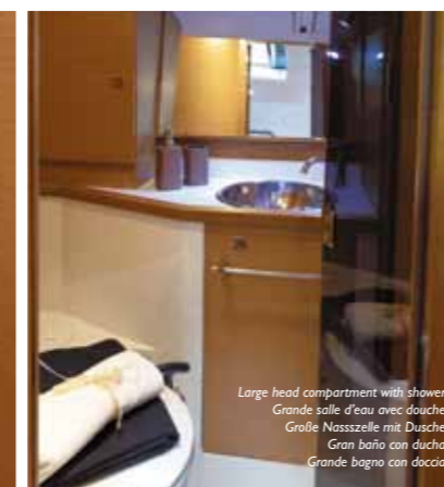
Large head compartment with shower Grande salle d'eau avec douche Große Nasszelle mit Dusche Gran baño con ducha Grande bagno con doccia