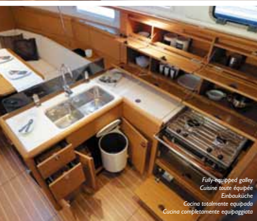
Fully equipped galley Cuisine toute équipée Einbauküche Cocina totalmente equipada Cucina completamente equipaggiata