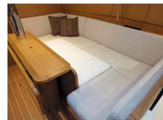
Folding table with bar cabinet and easy conversion into berth* Table repliable avec bar et transformation facile en couchette* Klappbarer Tisch mit Bar, einfache Umwandlung in einen Schlafplatz* Mesa plegable con bar y fácil transformación en cama* Tavolo pieghevole con bar e facilmente trasformabile in cuccetta* *Option