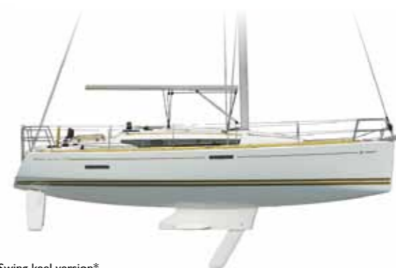
Swing keel version* Version dériveur* Drifter-Version* Versión velero* Versione deriva*